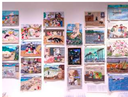
《物語るテーブルランナー》 2014年～ 各々 30×45cm 布地、刺繍糸、綿、ミクストメディア

© 2021 Tomoko Konoike Courtesy of Kadokawa Culture Museum