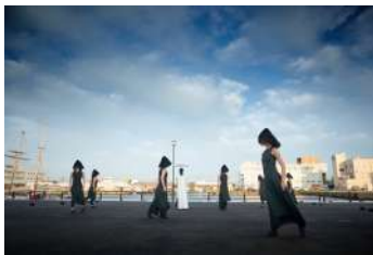
Noism2特別公演2018『ソーン』