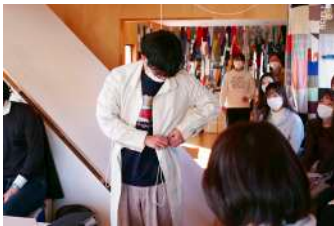
西尾研究室「DATSUEBA奈良」におけるワークショップの様子、2022年