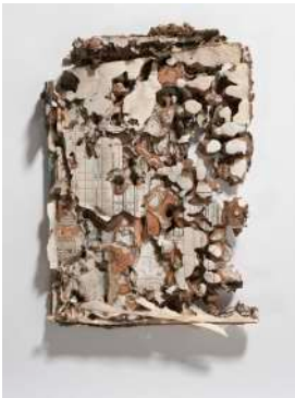
book (ing) No.12