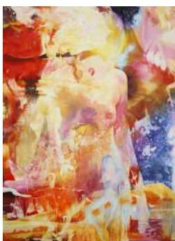
"/ 72" 2017 oil on canvas 2273x1620(mm)