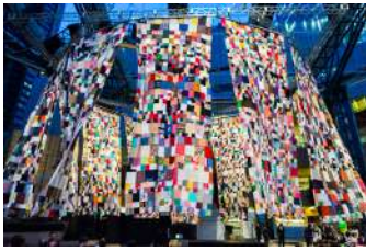
西尾美也《カラダひとつ：人間の家[スカート]》2014年 展示風景：「六本木アートナイト2014」2014年／ 六本木ヒルズアリーナ／東京