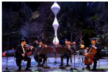
クラシックなラジオ体操