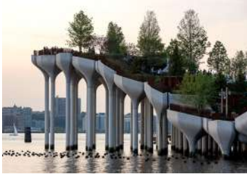
ヘザウィック・スタジオ《リトル・アイランド》 2021年 ニューヨーク