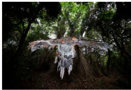
《大島皮トンビ》 2019年 約W12×H4m 牛革、水性塗料、クレヨン