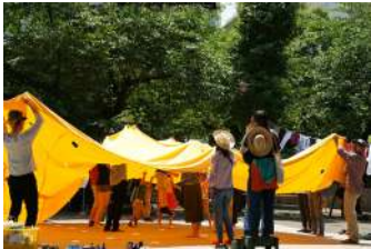
西尾美也《着がえる公園》2019年 展示風景：「六本木アートナイト2019」／三河台公園／東京