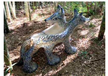
《狼ベンチ》 2022年 W1.9×D0.8×H1.1m FRP、水性塗料