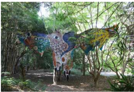
《高松一越前一静岡一六本木皮トンビ》 2022年 約W12×H5.5m 牛革、水性塗料、クレヨン