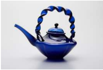
藍色ちろり 日本 18世紀 サントリー美術館 【全期間展示】