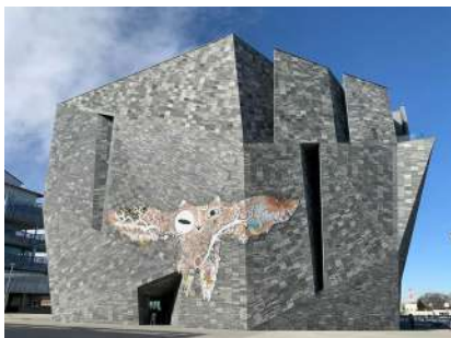
《武蔵野皮トンビ》 2021年 約W24×H10m 牛革、水性塗料、クレヨン 角川文化振興財団所蔵