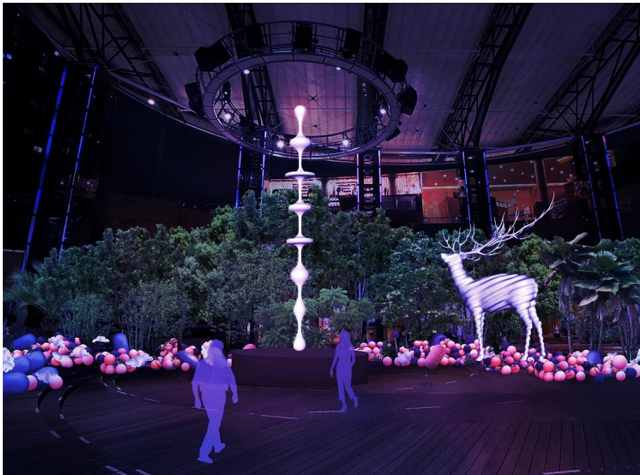
六本木ヒルズアリーナでの展開イメージ

六本木ヒルズアリーナでは、西畠が世界各国から集めた多種多様な樹木によって、成熟した森が構成されます。そこでは名和の彫刻作品「Ether」と「White Deer」が会うシーンが表現されます。「White Deer」は、岡山県の犬島で誕生し京都に立ち寄り、東京を彷徨い森のなかで「Ether」と出会います。その後、東北へと向かい、宮城県の牡鹿半島で来年開催される「Reborn-Art Festival 2017」で展示する予定です。また、六本木ヒルズアリーナには、石巻の漁で使用されているブイも配置され、都心の成熟した森に浮遊する海の物が混在する、幻想的な光景が出現します。