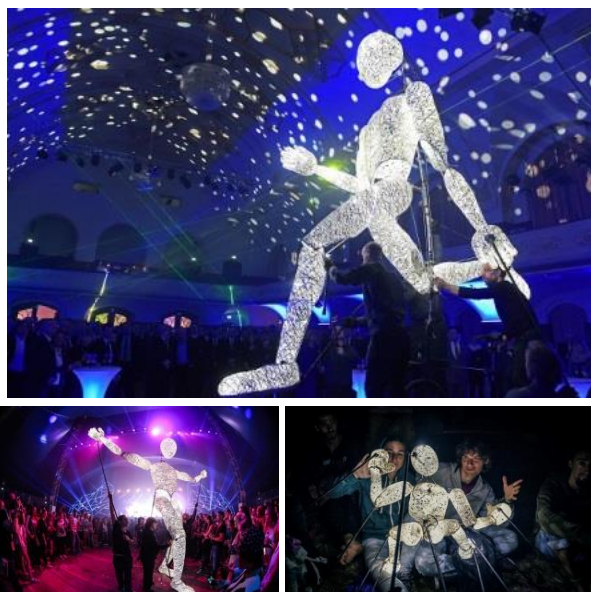
DUNDU by Tobias Husemann

ドイツ、シュトゥットガルトを本拠地とするパペットシアター・カンパニーDUNDU(ドウンドウ)が初来日決定！ 発光する5mもの巨大パペットが六本木アートナイト3拠点に登場し幻想的なパフォーマンスを繰り広げます。