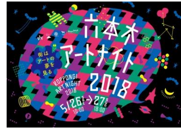
六本木アートナイト2018 メインビジュアル

また、「六本木アートナイト2018」の開催に先駆けて展示、設置するアートプログラムを「プレプログラム」としてお楽しみいただける期間を設け、より多くの方々に六本木アートナイトに触れていただく機会を創出いたします。