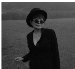
Yoko Ono