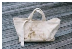
【インスタレーション】 JART 《ひったくられ続けるバッグ》 2018 鞆(布)、映像