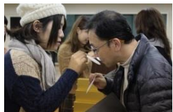
北浦和おかわり芸術祭 回遊美術館Ⅲ 2016年