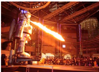
ヤノベケンジ《ジャイアント・トラやん》