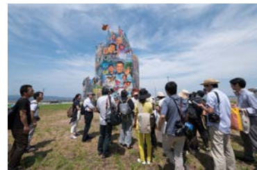
《OK Tower》 OK Tower, 2016

2012年に東京都青梅市に発足したアーティスト・コレクティブ「国立奥多摩美術館」。メンバーの多くは、東南アジアで作品発表の経験があります。今回はアジアをテーマに人が時計の針となる「24時間人間時計」に挑戦します。