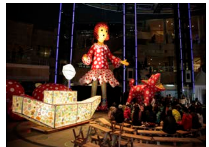
草間彌生《愛はとこしえ、未来は私のもの!》