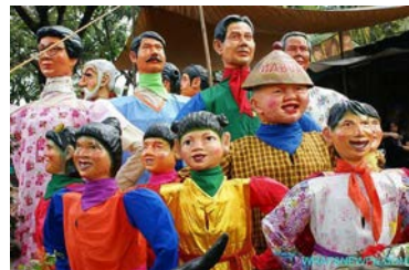
《Angono Gigantes, Big and Small》