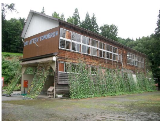
作品名: 明後日新聞文化事業部 2003年