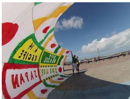
作品名: 『MATCH FLAG PROJECT』2014年

2003年(越後妻有アートトリエンナーレ 2003)新潟県十日町市筋平の廃校を本社に「明後日新聞文化事業部」を発足し、集落住民と共に朝顔を育てたことから活動を開始。この地で生まれた種は、日比野の各地での活動に呼応するように全国へと運ばれ、人と人が繋がり、大きなネットワークとなっている。現在29地域が参加。